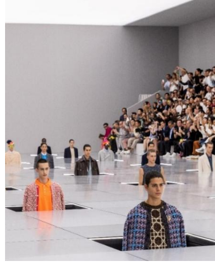
Şekil 3. Dior 2024 Yaz Erkek Defilesi, Fotoğraf Victor Boyko (Marain, 2023)

Markanın 1947 yılında gerçekleştirdiği ilk moda defilesi için konukların oturduğu sandalyelere kumaş ile kaplatılan çizgisel geometrik kompozisyondaki kurumsal desen, giyim ürünlerinin malzemelerine yansıtıldığı görülmektedir. Primal Scream'in "Higher Than the Sun" şarkısı eşliğinde işitsel algı desteklenmektedir. Kontrast bir sunum için gri metalik mekân yüzeylerindeki 3 adet yan yana olan hizada toplam 17 adet olan sıradaki ızgara planında konumlandırılan mankenlerle koreografi oluşturulmuştur (Leitch, 2023). Ayrıca Dior markasına ait tarihsel arka planından gelen kurumsal kimliğinin de fiziksel göstergeler olarak ızgara desenler, giyim ürünündeki neon renkler, doku özellikleri ve ölçek farklılıkları ile tekstil malzemelerinde yeniden kurgulanmıştır. Moda ürünlerinde marka kurgusu ürünlerin detaylarında somutlaştırılırken mekân verdiği yalın ve ön plana çıkaran görsel algı hâkimdir.