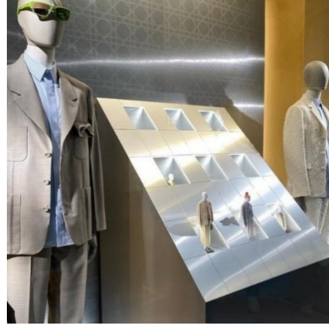
Şekil 6. Dior 2024 Yaz Vitrini, (Stephane Mathieu, 2024)

Tıpkı tasarlanan hazır giyim koleksiyonun malzeme detaylarında yaptığı kurumsal desenin ölçek farklılığı, vitrin hacminde de görülmektedir. Bu yaklaşım giyim ürünlerinin araştırılıp mekâna gösterge olarak yansıtılmasına örnektir. Vitrinde gerçek insan boyutuna sahip cansız mankenlere ve mini boy cansız mankenlere defilede sunulan koleksiyonlar giydirilmiştir. Bu mini boy mankenlerle teşhirde daha çok sergileme şansı kazanabildiği gibi boyutsal farklılıkla sempatik bir izlenim oluşturmaktadır. Bu izlenime defilede oluşturduğu dinamik algı göstergebilimsel kuramdaki gösteren fiziksel öğelerdir. Dior markasına ait mekanik bahçedeki çiçek erkekler kurgusu, hareketli sergi detayları ile sunum devam etmektedir. Kapalı vitrin hacminin içerisinde koyu renk kurumsal desenin oluşturduğu fon önündeki metalik kütesel stant ile kontrastlık gösteren öğeler olarak devam ettirilmiştir. Bu ünite de geleceği temsilen verdiği hareketli sergi sistemi ile fütürist uzay temsil eden gösterilen zihinsel kavram karşılığı olduğu görülmektedir. Vitrin tasarımlarındaki stabil yerleştirmeler yeni ve yaratıcı bir bakış açısı ile yeniden kurgulandığı görülmektedir. Araştırma metodunda incelenen göstergebilimsel anlam öğeleri kapsamındaki Dior kurgusal vitrin tasarım ilişkileri Tablo 1’de özetlenmektedir.