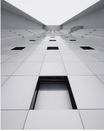
Şekil 2. Dior 2024 Yaz Erkek Defilesi, Fotoğraf Alfredo Piola (Parkers, 2023)