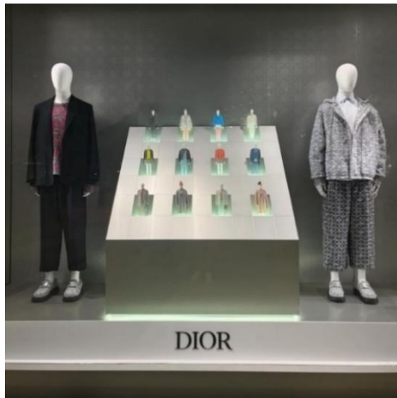
Şekil 4. Dior 2024 Yaz Vitrini, (Visualwindows, 2024)

Kurgusal tasarım yalnızca hayalli bir perspektif değildir. Gündelik pratik normlarını aşan, geleceğe doğru ilerleyen derin düşünce perspektifine sahiptir (Dindler, 2010). Mekân tasarımının etkili ara yüzü ile görsel deneyimin verildiği bu dinamik defile sunumudur. Klasik manken yürüyüşünün yanı sıra sürpriz bir şekilde çıkartılan mankenlerin hareketsizliği, tam karşılığındaki mekanik hareketlilik ile uzayı temsil eden fütürist bir kurgulama canlandırıldığı görülmektedir. Bu gösterilen öğeler zihinsel kavramdaki kurgusal anlatıma karşılıktır. İncelenen bu moda mekân arakesitindeki kurgunun devam ettirilmesi için vitrin mekânları da önemli bir aracı olarak uygulanmıştır. Fütüristik uzay kurgundaki bu dinamik görsel defile sunumu vitrin mekânındaki stabil sergilemenin de yerini almıştır. Dior defilesinde yakalanan bu etkili sergilemenin akılda kalıcı avantajı, güncel vitrin tasarımlarında da devam ettirildiği Şekil 4, 6 ve 6'da görülmektedir.