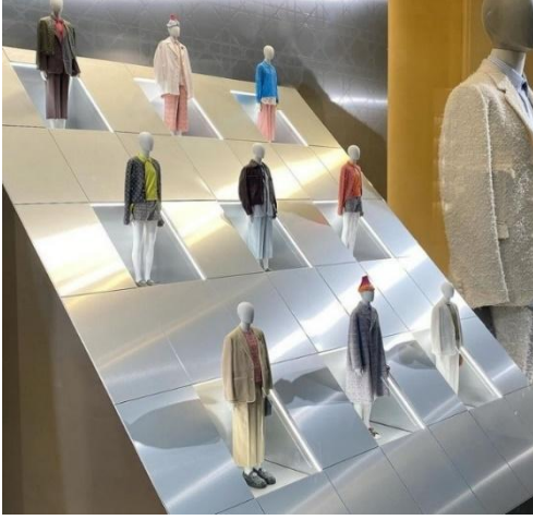
Şekil 5. Dior 2024 Yaz Vitrini, (Stephane Mathieu, 2024)